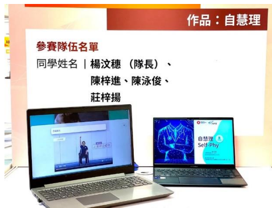
大專學生組金獎-自慧理