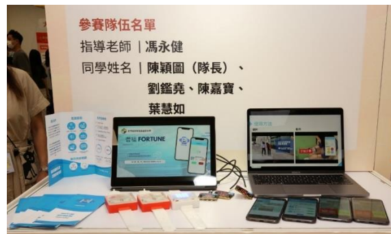
中學生組銅獎-耆福