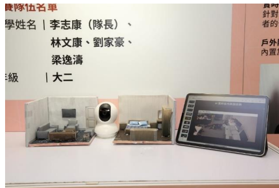
大專學生組銅獎-頂級安全