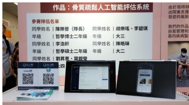
大專學生組銀獎-骨質疏鬆人工智能評估系統